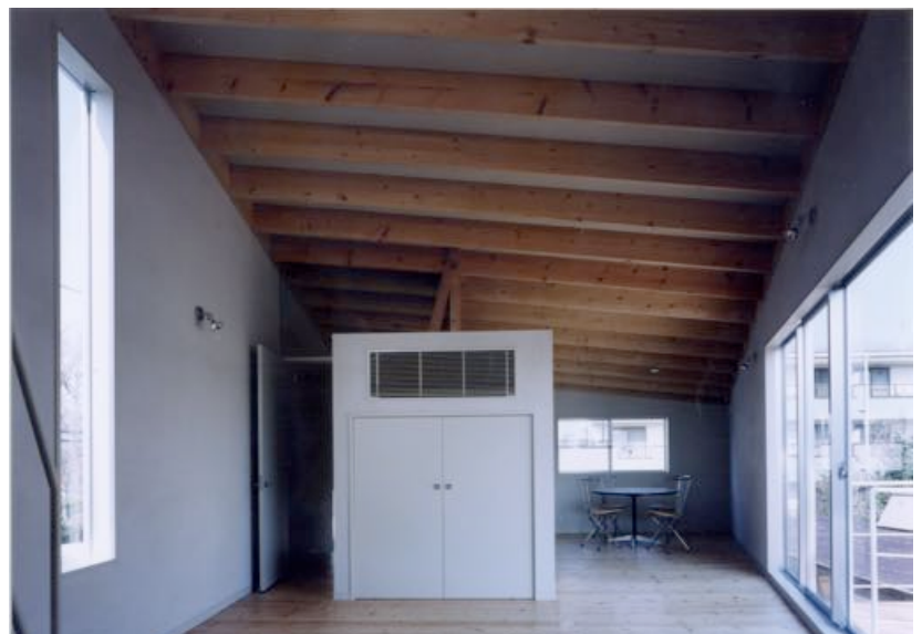
■居間よりキッチン方向を見る。