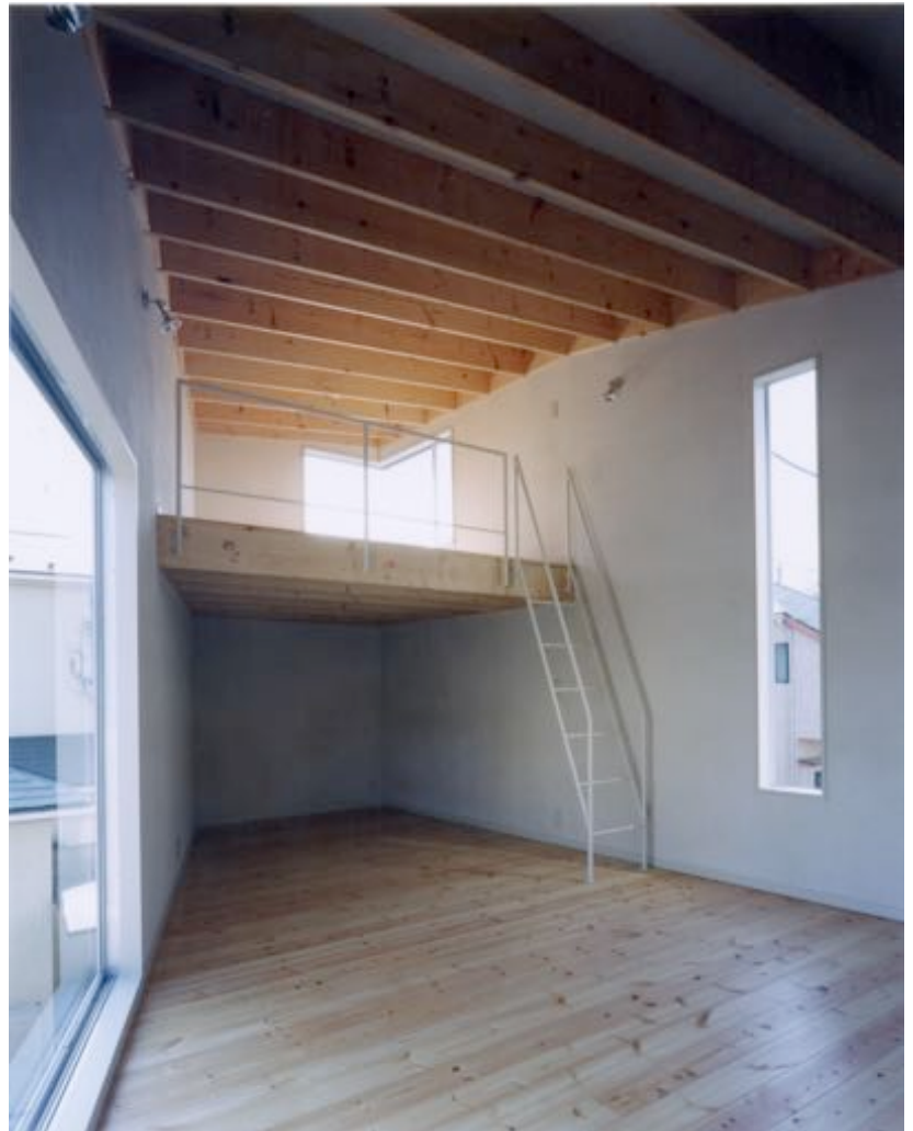
■居間。奥にロフトが見える。壁は珪藻土、床はパイン無垢材。