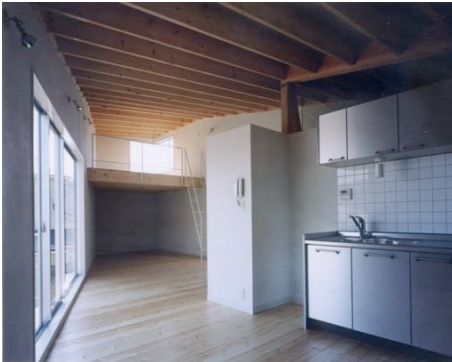
■キッチンより居間方向を見る。