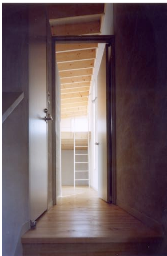
■ 階段室より居間方向を見る。