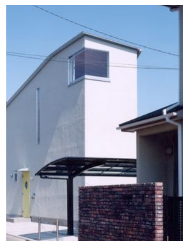
■ 台形平面の短辺は2mのシャープな外観