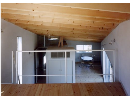
■ロフトよりキッチン方向を見る。